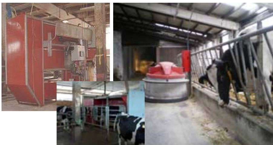
Melkroboter / automatisierter Futterschieber