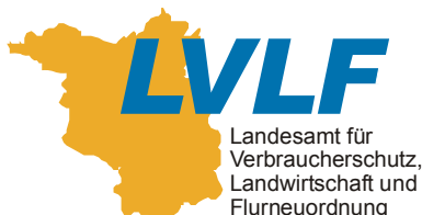
Landesamt für Verbraucherschutz, Landwirtschaft und Flurneuordnung