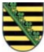
Sächsisches Landesamt für Umwelt, Landwirtschaft und Geologie