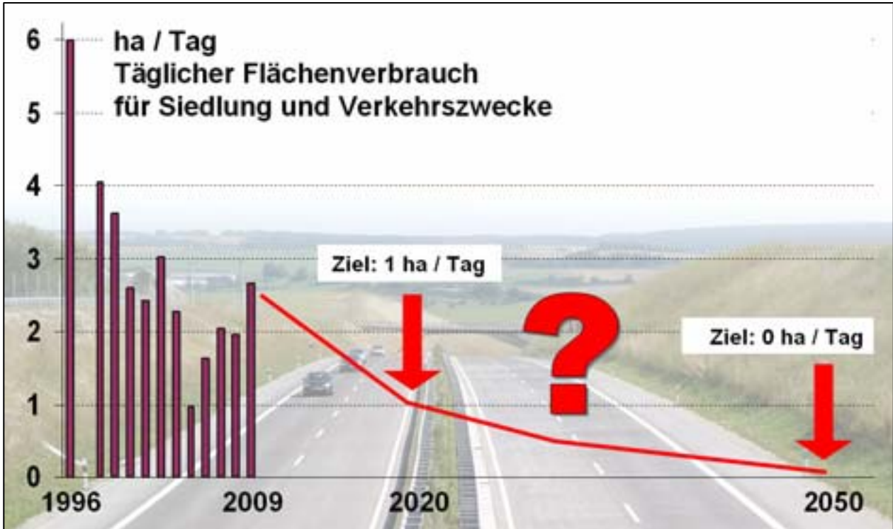
Abbildung 2: Entwicklung des täglichen Flächenverbrauches in Thüringen ab 1996 sowie strategische Ziele und Prognose bis 2050

Bei Unterstellung einer kontinuierlichen Absenkung des täglichen Flächenverbrauches auf einen Hektar im Jahr 2020 und Null Hektar im Jahr 2050 wäre es möglich, den aufgezeigten Flächenbedarf problemlos zu realisieren (Abb. 2). Eine wirksame Minimierung des Flächenverbrauches erfordert daher die Umsetzung der Empfehlung des Beirates zur nachhaltigen Entwicklung in Thüringen, bereits 2020 ein Null-Saldo des Netto-Flächenverbrauches anzustreben.