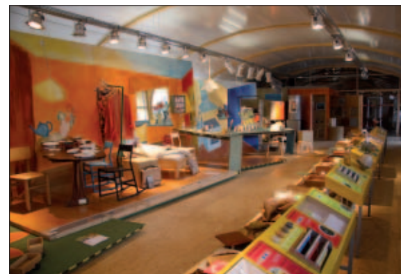
Im Pavillon Nachwachsende Rohstoffe

schaftlicher Erkenntnisse in die Praxis erfolgen. Unter dieser Internetadresse werden Veranstaltungstipps, Forschungsergebnisse, Förderprogramme sowie interessante Projekte im Punkt „News“ vorgestellt. Seit Februar 2008 kann der Pavillon Nachwachsende Rohstoffe, der BUGA 2007, auf dem Gelände der Thüringer Landesanstalt für Landwirtschaft in Jena-Zwätzen besichtigt werden. Hier werden Besuchergruppen hautnah an das Thema: „Leben mit Nachwachsenden Rohstoffen“ herangeführt. Weiterhin besteht auch die Möglichkeit Informationsveranstaltungen im Pavillon durchzuführen.