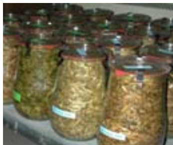
Abb. 1: Modellsilos

Parameter charakterisiert: Trockenmasse, pH-Wert, Zucker- und Stärkegehalt, Rohnährstoffe, Faserfraktionen sowie Gärprodukte (Tab. 1). Die Korrektur der Trockenmasse erfolgte in Abhängigkeit vom pH-Wert nach Weissbach & Kuhla (1995). Die Bewertung der Silagen auf der Basis der chemischen Untersuchungen erfolgt nach dem aktuellen Bewertungsschlüssel der DLG (DLG, 2006).