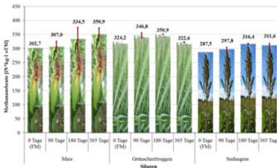
Abb. 4: Methanausbeuten von Mais-, Grünschnittroggen- und Sudangrassilagen nach unterschiedlichen Lagerzeiten in Modellsilos unter Berücksichtigung der Gärverluste

An den gleichen Siliergütern wurden die Auswirkungen variiert Lagerzeiten von 10 bis 365 Tagen auf die Methanausbeuten untersucht (Abb. 4).