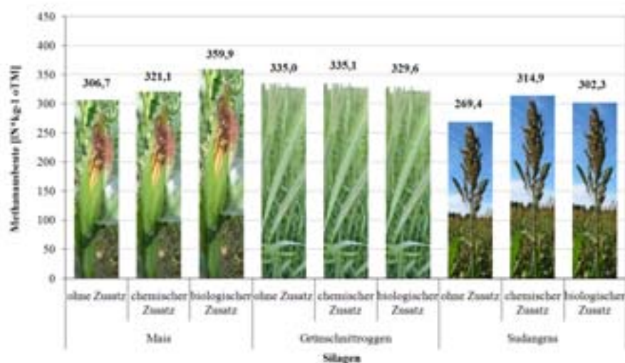
Abb. 3: Einfluss von Silierzusätzen auf die Methanausbeuten von Mais-, Grünschnittroggen- und Sudangrasssilagen nach 90tägiger Lagerungszeit in Modellsilos unter Berücksichtigung der Gärverluste

Auf die Methanausbeuten wirkten sich die Silierzusätze in den getesteten Pflanzen unterschiedlich aus. In Maissilagen bewirkten die Zusätze zum einen eine Verbesserung der Gärqualität: die Konservate ohne Zusatz wurden mit der Note 3 (verbesserungswürdig), die mit dem biologischen Zusatz mit der Note 2 (gut) und die mit chemischem Zusatz mit der Note 1 (sehr gut) bewertet. Zum anderen konnte auch die Methanausbeute durch die Zusätze erhöht werden. Unter Berücksichtigung der Gärverluste erbrachte der speziell für die Biomethanisierung ausgewählte Zusatz Silasil mit 359,9 NI/kg oTM nach 90-tägiger Silierzeit die höchsten Ausbeuten (Abb. 3). Durch den chemischen Zusatz Mais Kofasil liquid konnte die Methanausbeute von 321,1 NI/kg oTM gegenüber der unbehandelten Kontrolle um 4,7 % erhöht werden.