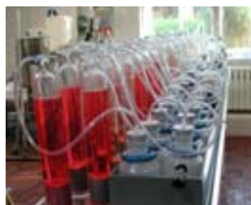
Abb. 2: Batch-Gärtests