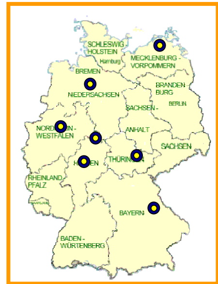
Abb. 3: Standorte Teilprojekt 6

Zum Herbst 2005 wurde ein weiteres Teilprojekt VI (s. Abb. 1) „Systemversuch zum Zweikultur-Nutzungssystem auf sieben Standorten im Bundesgebiet“ in den Verbund integriert. Diese Themenstellung wird von der Universität Kassel (UNI-Kassel, Witzenhausen) bearbeitet und soll Aufschluss geben über die Eignung dieses Systems im Energiepflanzenanbau. Im Prinzip wird die im Grundversuch geprüfte Variante Winterzwischenfrucht Winterroggen - Zweitfrucht Mais mit weiteren Kombinationen untersucht und einer vertiefenden Betrachtung unterzogen. Partner und Standorte sind in diesem Projekt die Uni-Kassel (Witzenhausen, HE), die TLL (Dornburg, TH), die Uni-Gießen (Eichhof, HE), das TFZ (Ascha, BY), die LFA (Gülzow, MV), die LWK-NS (Wehnen, NS) und die LWK-NRW (Haus Düsse, NRW; siehe Abb. 3).