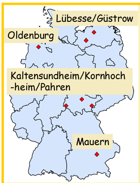
Abb. 4: Standorte der Praxisbetriebe

Um die Wissenschaft mit der Praxis zu verbinden, sind bereits zeitgleich mit dem Verbundprojekt, für die ökologischen und ökonomischen Bewertungen, Praxisversuche (s. Abb. 1 auf S. 2) angelaufen, die eine direkte Einschätzung von Energiepflanzenkulturen unter Praxisbedingungen ermöglichen. Die Standorte der Praxisbetriebe sind in Abb. 4 dargestellt, die angebaute Fruchtarten in Tabelle 6.