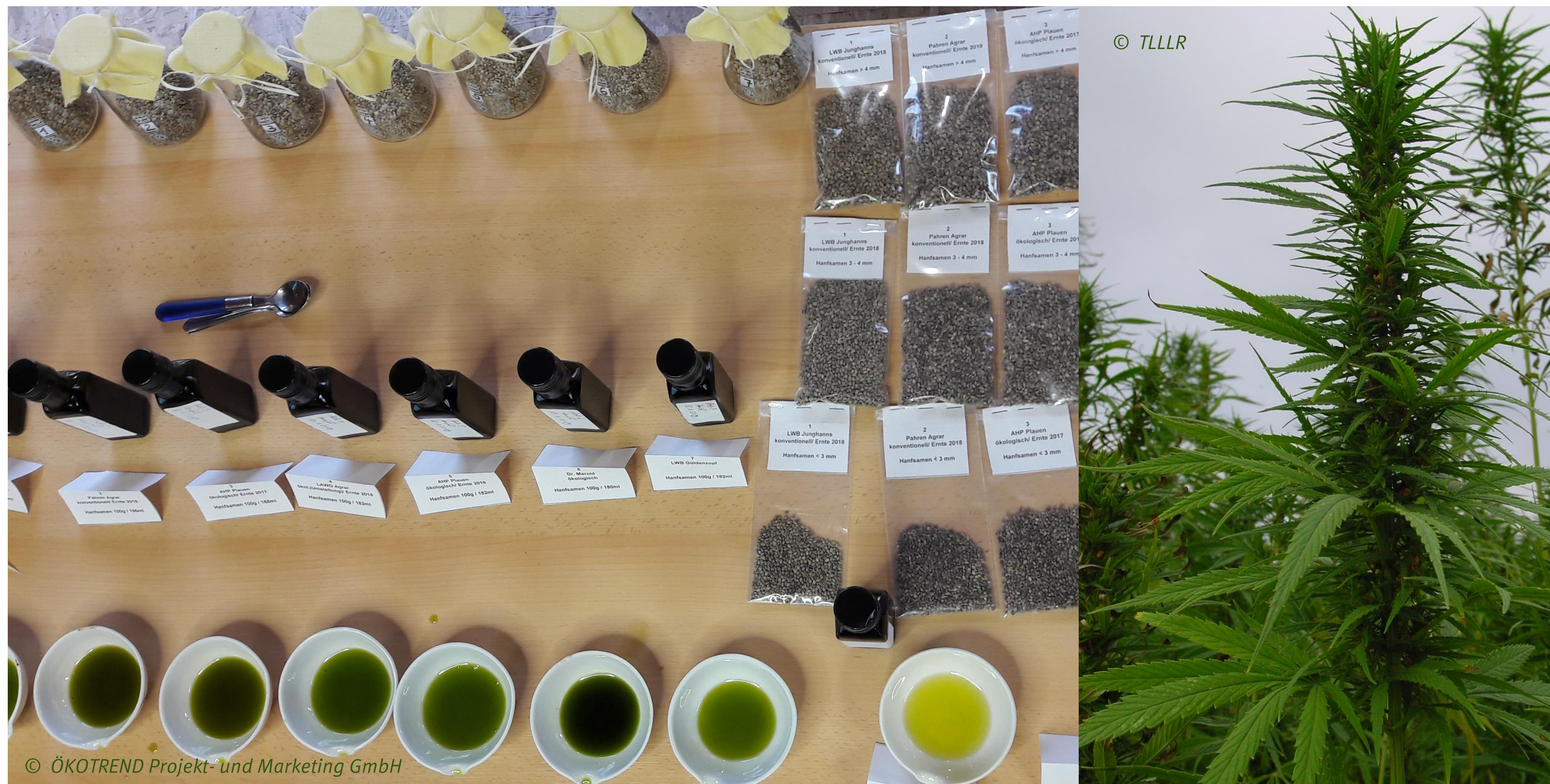
Abbildung 1: Probeöle der Kooperationspartner und Hanfbestand

Im Rahmen des Projektes soll ein Netzwerk von Hanf anbauenden und -verarbeitenden Betrieben in Thüringen und angrenzenden Regionen aufgebaut und etabliert werden, mit dem Ziel, die Samen zu wertvollen Ölen und Eiweißen für die Humanernährung zu verarbeiten.