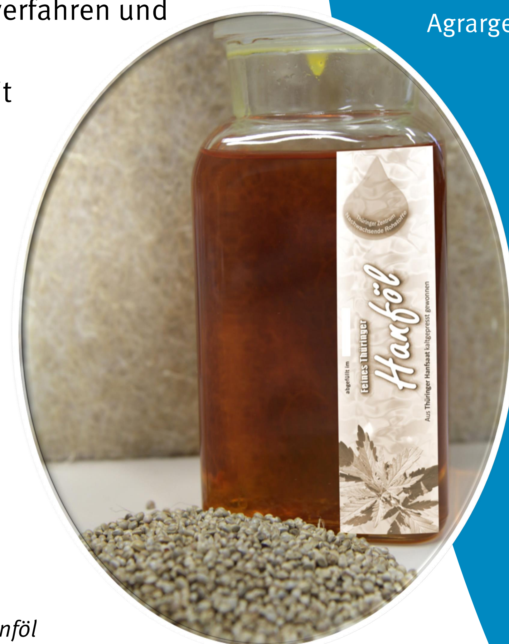
Abbildung 2: Kaltgepresstes Hanföl

Das Projekt befasst sich außerdem mit der Etablierung regionaler Wertschöpfungsketten, die Erzeugung, Verarbeitung und Vermarktung gleichermaßen einschließen.