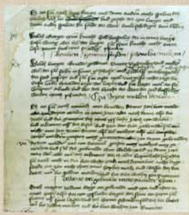
Das Weißenseer Reinheitsgebot 1434