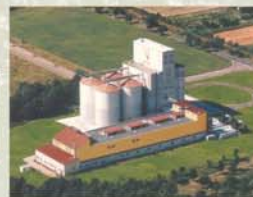
Thüringer Malz GmbH Clingen

Bierproduktion 2006 in Thüringen: 3,6 Mio. hl