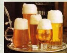
Gebraut in 25 Braustätten

Bierproduktion 2006 in Thüringen: 3,6 Mio. hl