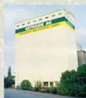
Erfurter Malzwerke GmbH